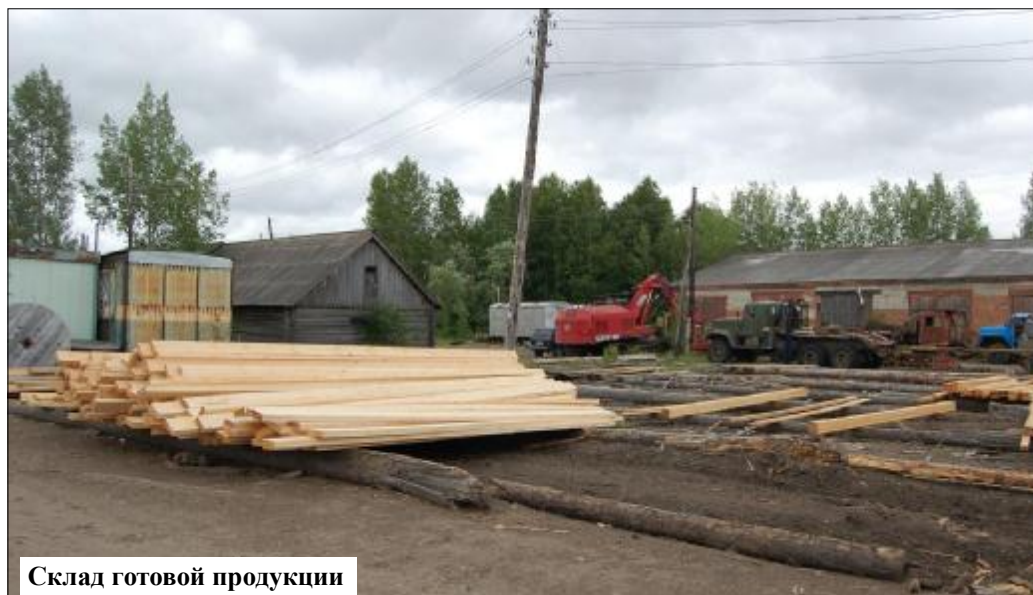
Склад готовой продукции

- Да. У нас около 30 единиц техники и предстоит хорошо потрудиться, чтобы подготовить их к зимнему комплексу. Большой объём предстоит выполнить на строительстве куста на Крапивином месторождении.