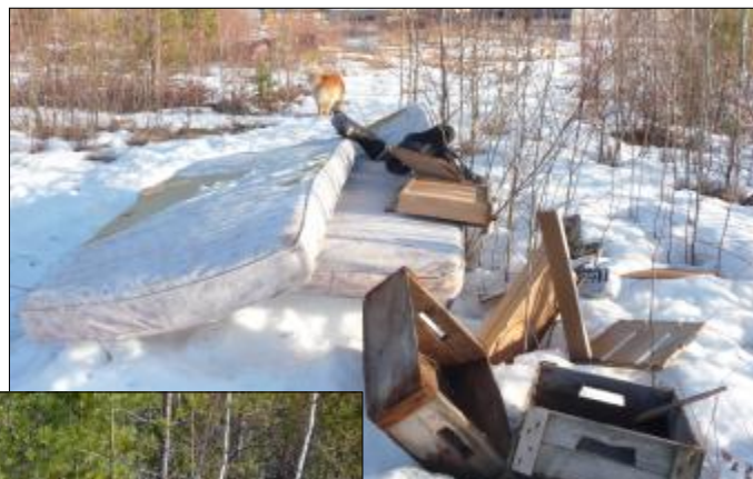
Участок между улицами Дружбы народов и Студенческой