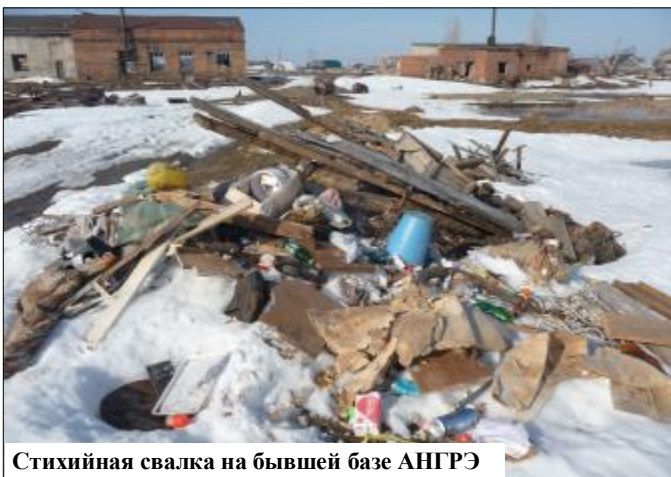
Стихийная свалка на бывшей базе АНГРЭ

На местном НПЗ от населения отработанные масла принимаются на утилизацию совершенно бесплатно.