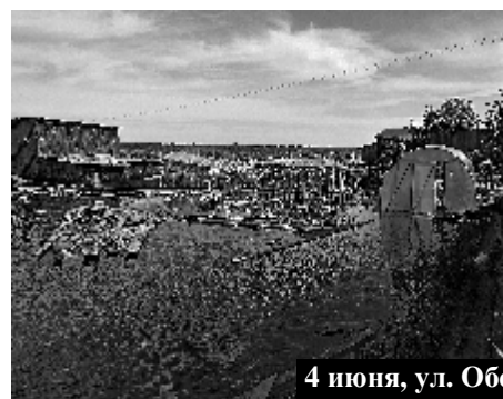
4 июня, ул. Обская