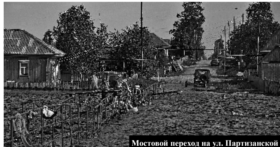
Мостовой переход на ул. Партизанской