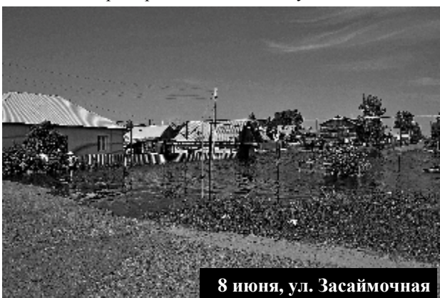
8 июня, ул. Засаймочная

Всего на территории Томской области подтоплены 897 приусадебных участков в 19 населённых пунктах пяти муниципальных образований. Из них: 360 в Молчановском районе, 161 в Колпашевском районе, 223 в Парabelьском районе, 93 в Кургасокском районе, 60 в Александровском районе.