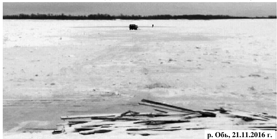
р. Обь, 21.11.2016 г.