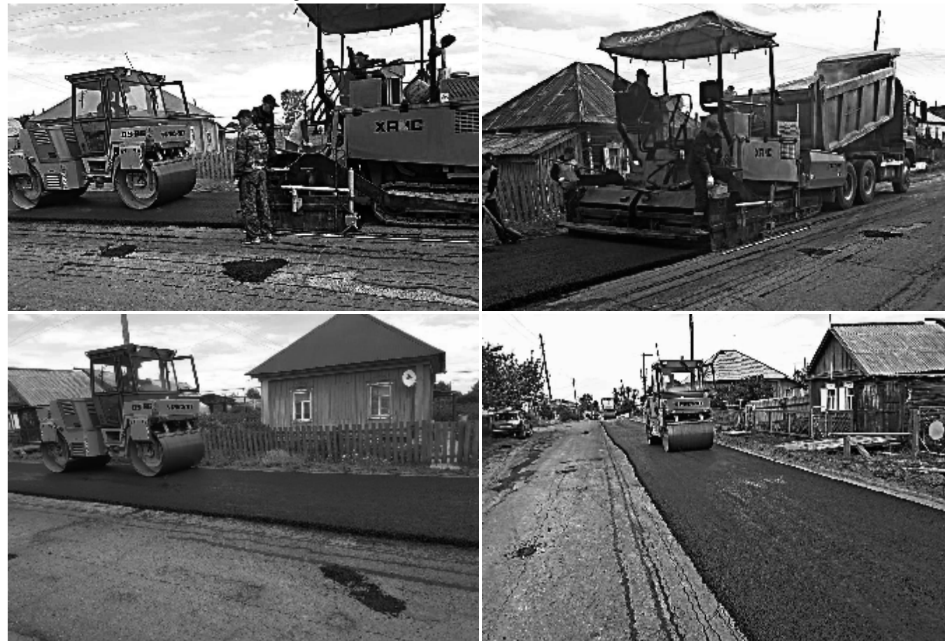
• Материалы 2, 3 полосы подготовили Иван МОСКВИН, Оксана ГЕНЗЕ, Ирина ПАРФЁНОВА.

Как заверил подрядчик, качество выполняемой работы соответствует всем нормативным показателям.