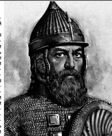
Дмитрий Михайлович ПОЖАРСКИЙ (1578 - 1642 гг.)

В это время в Москве находился польско-литовский гарнизон в 3 тысячи человек. Он испытывал трудности с продовольствием. На помощь этому гарнизону из Речи Посполитой поспешил гетман Ходкевич с войском в 12 тысяч человек (из них 8 тысяч запорожских казаков), его сопровождал обоз с продовольствием и снаряжением в 400 повозок. Стремясь не допустить соединения вражеских сил, Пожарский и Минин с армией в 8-10 тысяч человек устремились из Ярославля к Москве и 20 августа 1612 г. подошли к столице, опередив Ходкевича всего на один день (подошёл 21 августа). 22-24 августа 1612 года под Москвой происходило ожесточённое сражение. Ходкевич рвался к Кремлю и Белому городу в центре Москвы, где засел 3-х тысячный польско-литовский гарнизон, он не дошёл до него примерно 1800 метров. В этот критический момент на помощь Второму ополчению пришли остатки Первого ополчения - казаки князя Трубецкого (2,5 тысяч человек), до этого занимавшие в целом выжидательную позицию.