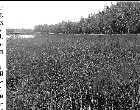
Рекультивированный участок вдоль трассы нефтепровода

листы и коллеги из Стрежевского ДРСУ изучают рынок специализированных машин для обновления существующего парка, - сказал собеседник.