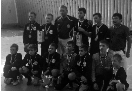
Команда Александровского района стала призёром финала Кубка России (Восточный дивизион) по футболу (2003 - 2004 г.р.)

«Томскнефть» выделила средства и для Культурно-спортивного комплекса. Для тира закуплены винтовки