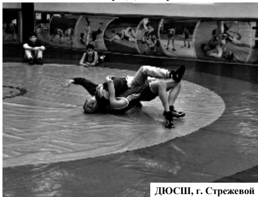
ДЮСШ, г. Стрежевой

Наиболее затратное приобретение - мячи волейбольные. Всего их закуплено 12 на сумму свыше 60 тысяч рублей. А ещё для занятий приобрели сетку, специальный счётчик и эспандер. Для гиревиков -