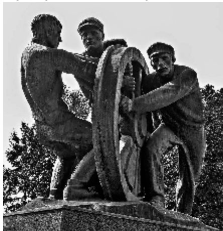
Памятник первому коммунистическому субботнику (г. Москва)

революционного энтузиазма становилось всё меньше. Принцип добровольности при проведении субботников фактически превратился в «добровольно-принудительный». На предприятиях и в учреждениях администрация просто объявляла дату очередного выходного дня (в 1967 г. к выходным дням добавили субботу), когда люди вместо отдыха должны были бесплатно работать. Редко кто решался выразить несогласие, как правило, люди предпочитали не спорить с властью.