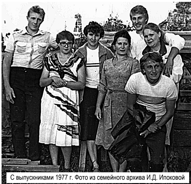
С выпускниками 1977 г.

Администрация и педагогический коллектив МАОУ СОШ № 1 с. Александровское